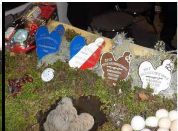
Prijzen tafel van de Franse hoenderclub