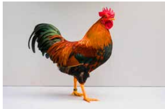
De winnende Welsummerkriel m/o